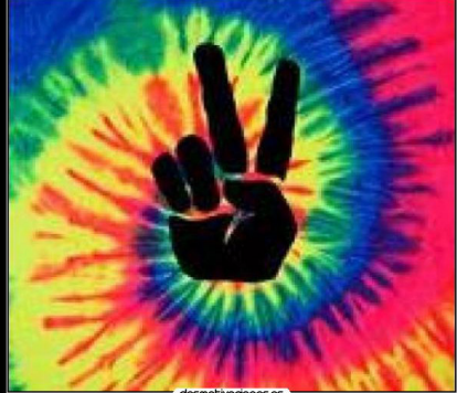
Paz, amor y el plus pal salón