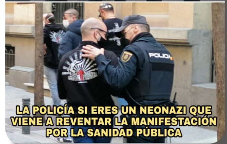
LA POLICÍA SI ERES UN NEONAZI QUE VIENE A REVENTAR LA MANIFESTACIÓN POR LA SANIDAD PÚBLICA