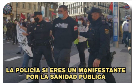
LA POLICÍA SI ERES UN MANIFESTANTE POR LA SANIDAD PÚBLICA