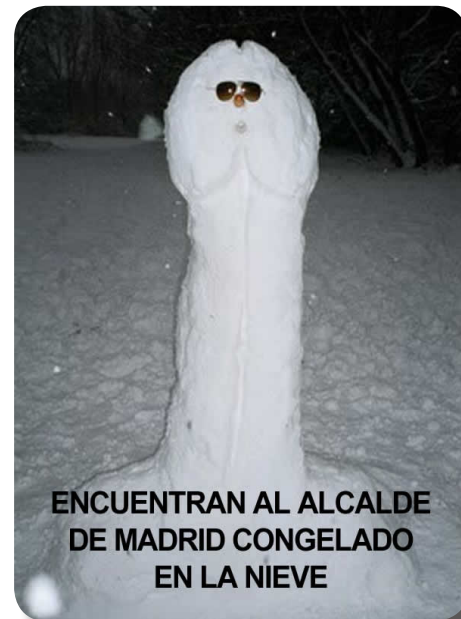
ENCUENTRAN AL ALCALDE DE MADRID CONGELADO EN LA NIEVE

"Año de nieves, año de bienes" bonito refrán, pero no será con estos especímenes que gobiernan el ayuntamiento de la capital. Después de la pésima gestión, las excusas y la propaganda "pala-selfie" en mano; la última ocurrencia de "Almedia persona" es pedir a las arcas públicas la ingente cantidad de 1400 millones de Euros. Para hacerse una idea de la cantidad de dinero que se trata, sería como 3 veces lo que costo el terremoto de Lorca o el Tsunami de Indonesia. Barrios enteros incomunicados durante días (solo los de clase trabajadora y no el barrio Salamanca), kilos y kilos de basura sin recoger y miles de tropiezos y lesiones de peatones, son sólo una muestra de cómo no se tienen que hacer las cosas. Cero previsión por parte de la Administración, a pesar de las advertencias de los expertos, es la consecuencia de estar bailando la conga junto a los reyes magos mientras le trasladaban esa información. No seremos nosotras quien estemos en contra de la pareja de baile "Almedia-Ayuso", que nos hace tanta gracia, pero deberían estar para lo que están, que para eso se les paga. Pónganse a trabajar, cuiden de los servicios públicos, dejen de regalar dinero a sus amigos y por favor dejen de hacer el ridículo.