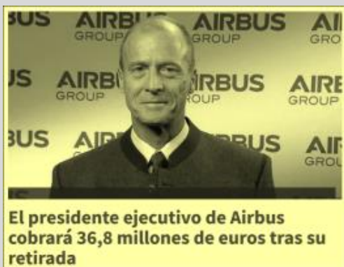
El presidente ejecutivo de Airbus cobrará 36,8 millones de euros tras su retirada

Después de mucho marearnos, parece que la dirección va dando pistas de por dónde van los tiros para aligerar el geriátrico y rejuvenecer la plantilla.